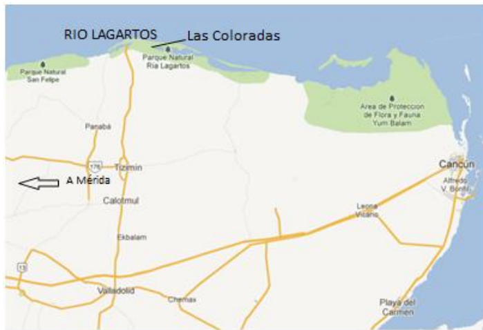
Mapa de la Península de

Para cualquier información adicional, estará a su disposición el personal del comité organizador que tendrá gafetes diferentes al resto de los participantes, lo que le permitirán a usted identificarlos fácilmente.